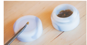
Dab, una forma concentrada de marihuana con instrumento dab

La investigación también demuestra que 1 de cada 6 adolescentes que usa la marihuana repetidamente pueden quedar adicto a la sustancia, comparados con 1 de cada 9 adultos. Además, los jóvenes que vapean tienen más probabilidad de usar cigarrillos convencionales y de probar la marihuana que los jóvenes que no vapean.