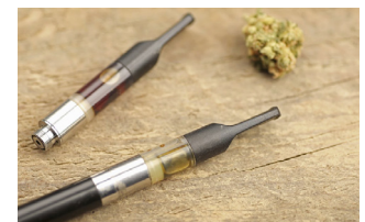
Vapeador usado con aceite THC