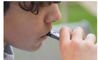
Adolescente usando un JUUL

..... Casi 1 de cada 3 graduados de secundario intentó vapear el año pasado.