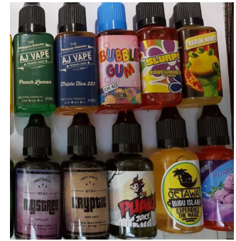
Los sabores son la más grande atracción del vapeo.